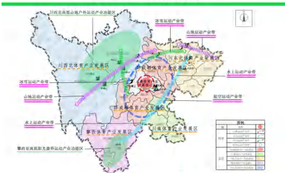
四川省“十四五”体育产业发展空间布局图

深度融入“一千多支、五区协同”区域发展新格局，结合全省体育产业资源禀赋条件，按照“111335”体育产业发展思路，构建“一核一轴四带五区”体育产业空间布局。充分发挥成都“头雁引领”极核作用，引领带动全省体育产业加快发展。着力建设山地运动、水上运动、冰雪运动、航空运动四大运动产业带，推动全省户外运动产业健康发展。加快推进环成都、川南、川东北、攀西、川西北生态等5个体育产业发展区协同发展。构建成渝体育产业发展主轴，建立成渝体育产业联盟，支撑带动川渝体育产业一体化发展，与重庆市共建国家体育旅游示范区、国家级体育产业协同创新中心。