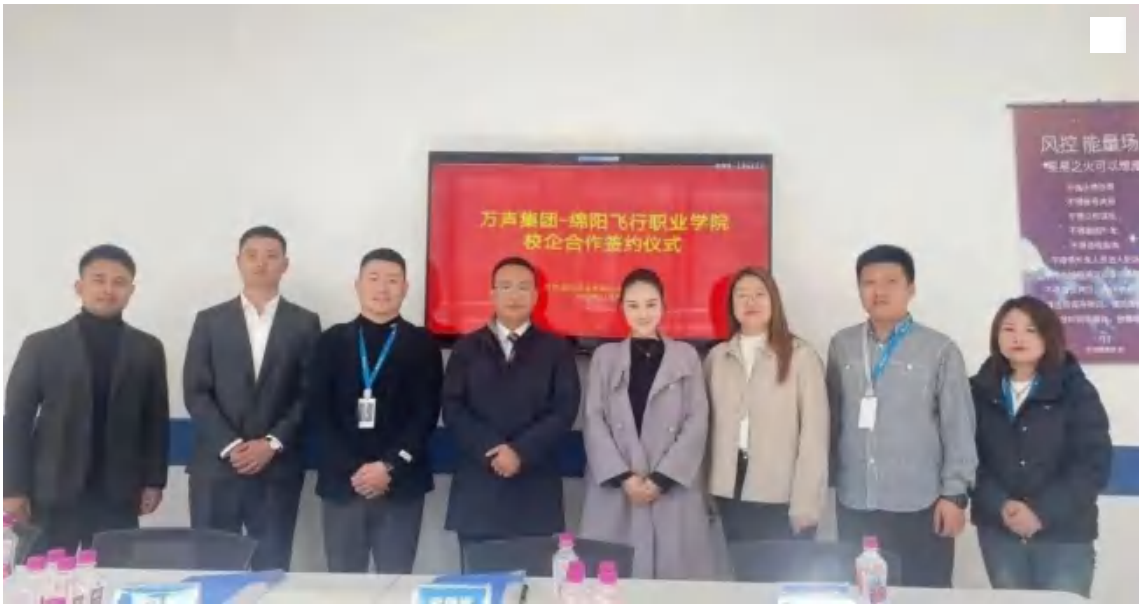
绵阳飞行职业学院与万声科技集团正式签署校企合作协议书