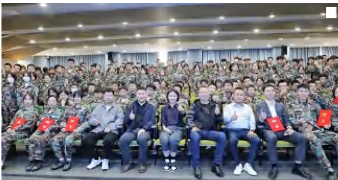
智能科技产业学院产教融合项目表彰大会隆重召开