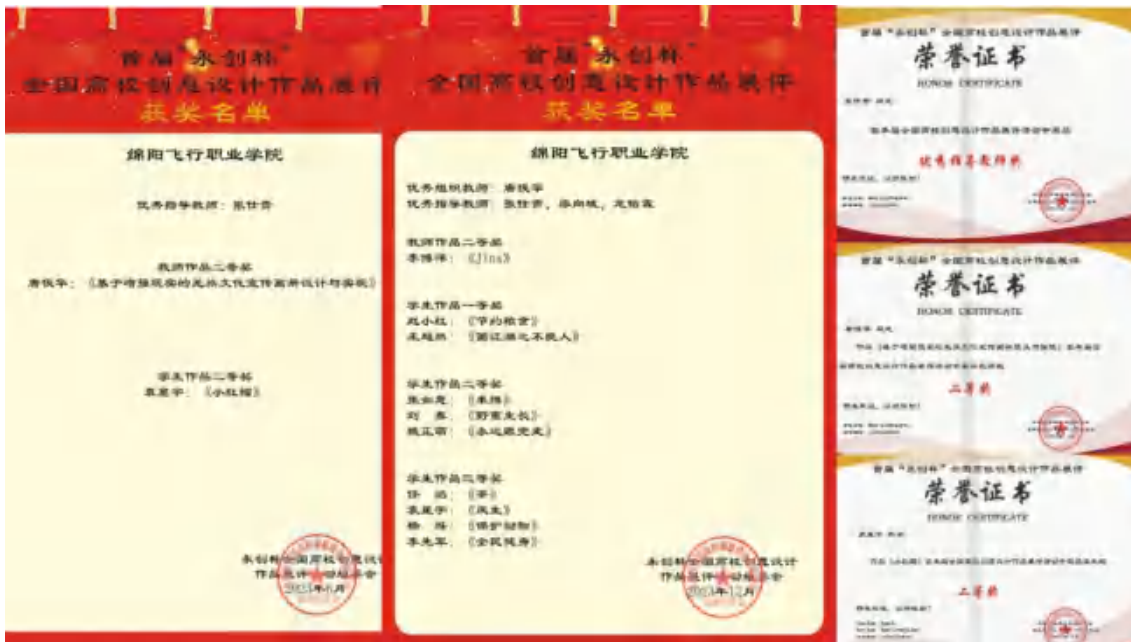
智科学院师生在首届“永创杯”全国高校创意设计作品征集活动、第15届全国大学生广告艺术大赛中屡获佳绩